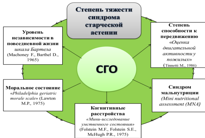
Рис. 1. Специализированный гериатрический осмотр.