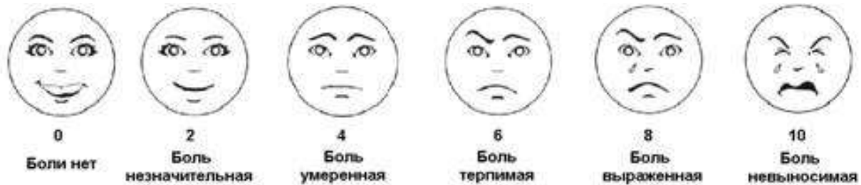
Рис.2 Шкала гримас Вонг-Бейкера предназначена для оценки состояния взрослых подопечных и детей старше 3 лет.

Шкала гримас состоит из 6 лиц, начиная от смеющегося (нет боли) до плачущего (боль невыносимая).